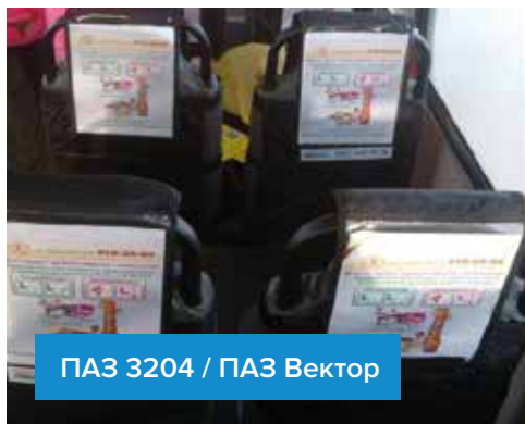
ПАЗ 3204 / ПАЗ Вектор